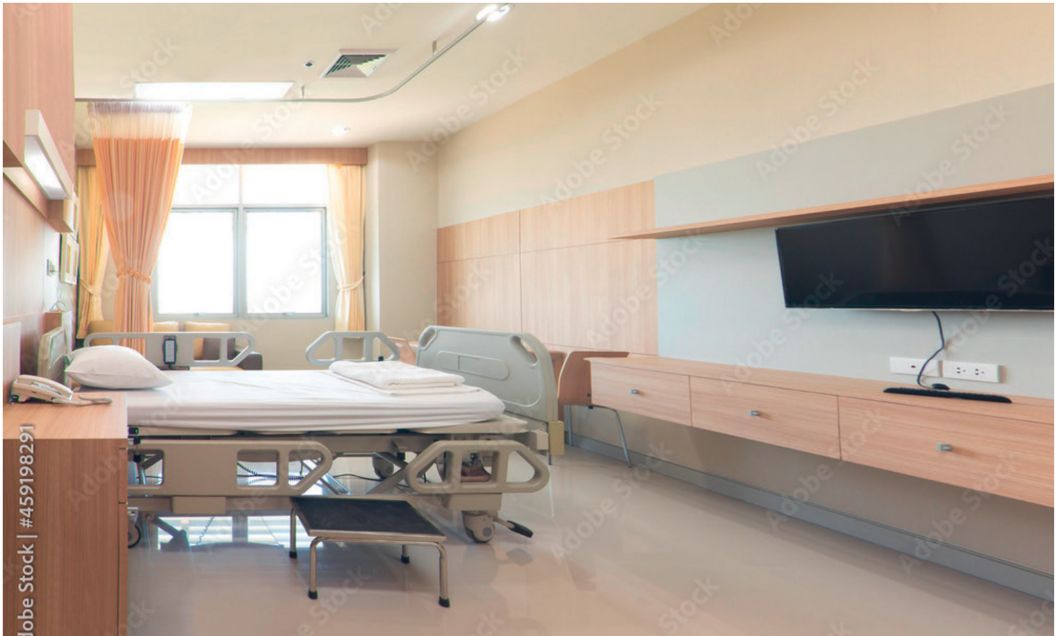
Zukünftig wird es nur noch Ein- und Zweibettzimmer geben. Zusätzliche Differenzierung erfolgt über andere Mehrleistungen

Staat. Und: Insbesondere profitieren auch die Grundversicherten.